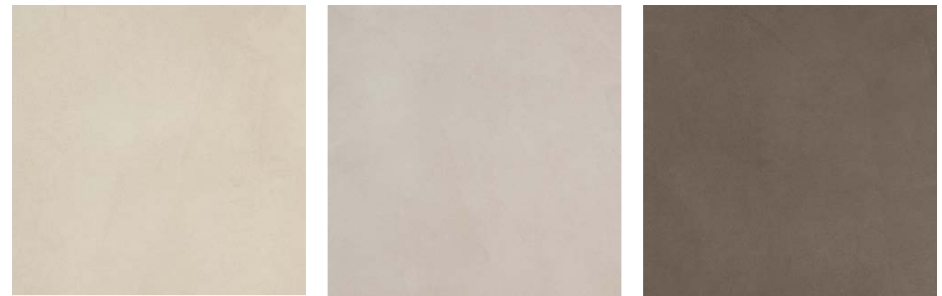
Beige Greige Mocha