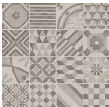
MH93 Decoro Mix 15x15*