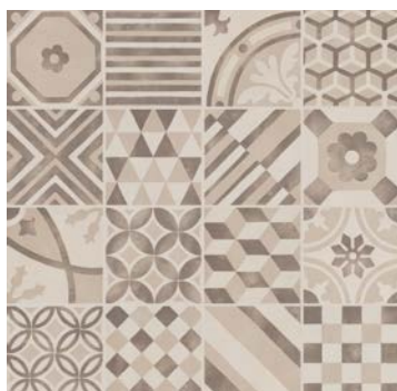
MH92 Decoro Mix 15x15*