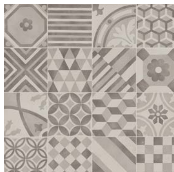
MH2K Decoro Mix 15x15