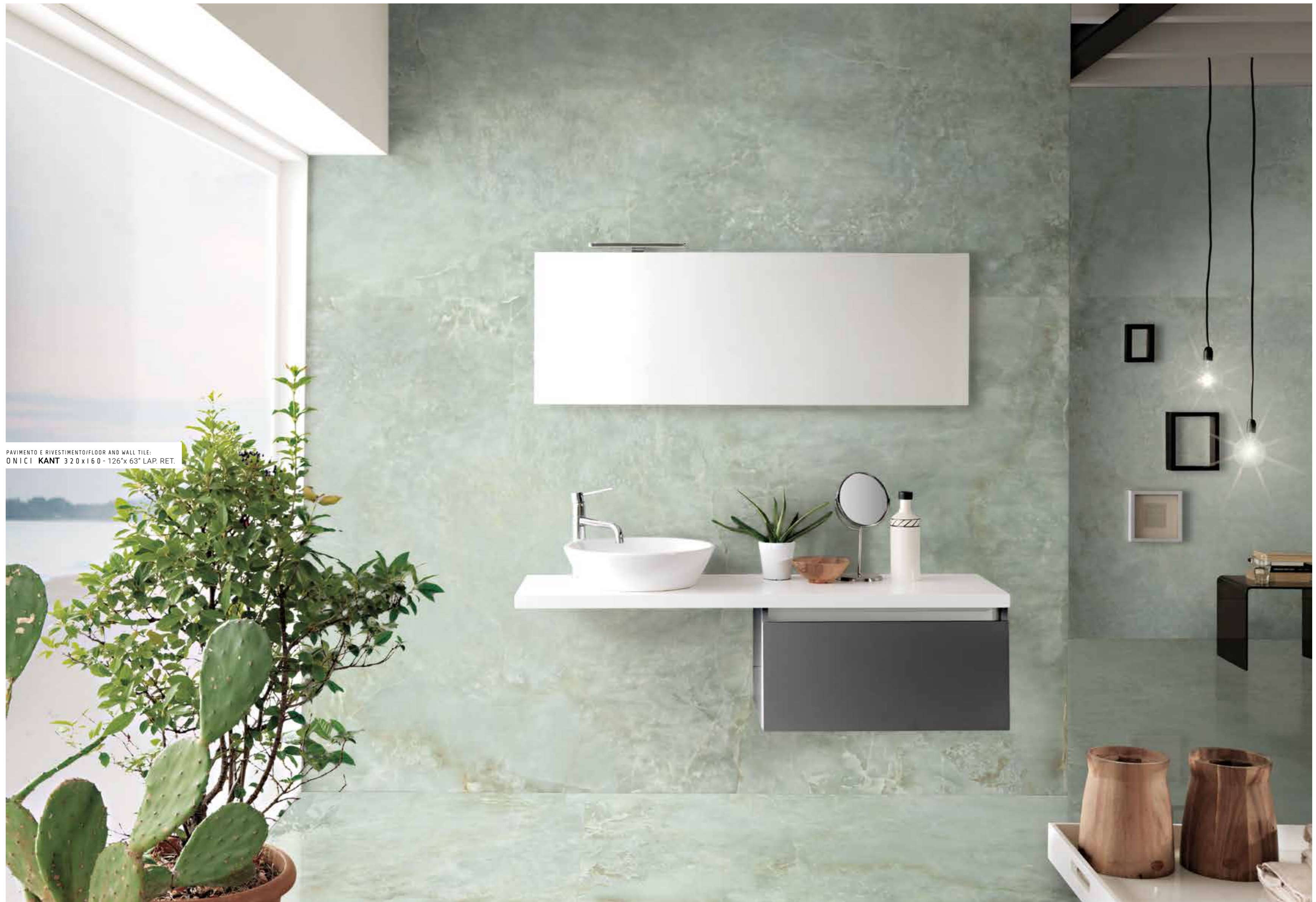
PAVIMENTO E RIVESTIMENTO/FLOOR AND WALL TILE: ONICI KANT 320 x 160 - 126"x 63" LAP. RET.