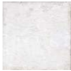
Aged White 20x20 cm C-430