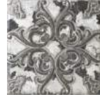
Aged Decor* 20x20 cm C-345