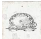
Aged Kitchen Decor *** 20x20 cm C-80

* Aged Ornato is available in 5 different aleatory reliefs. Aged Ornato está disponible en 5 relieves diferentes aleatorios.