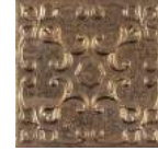
Aged Copper Ornato * 20x20 cm C-320