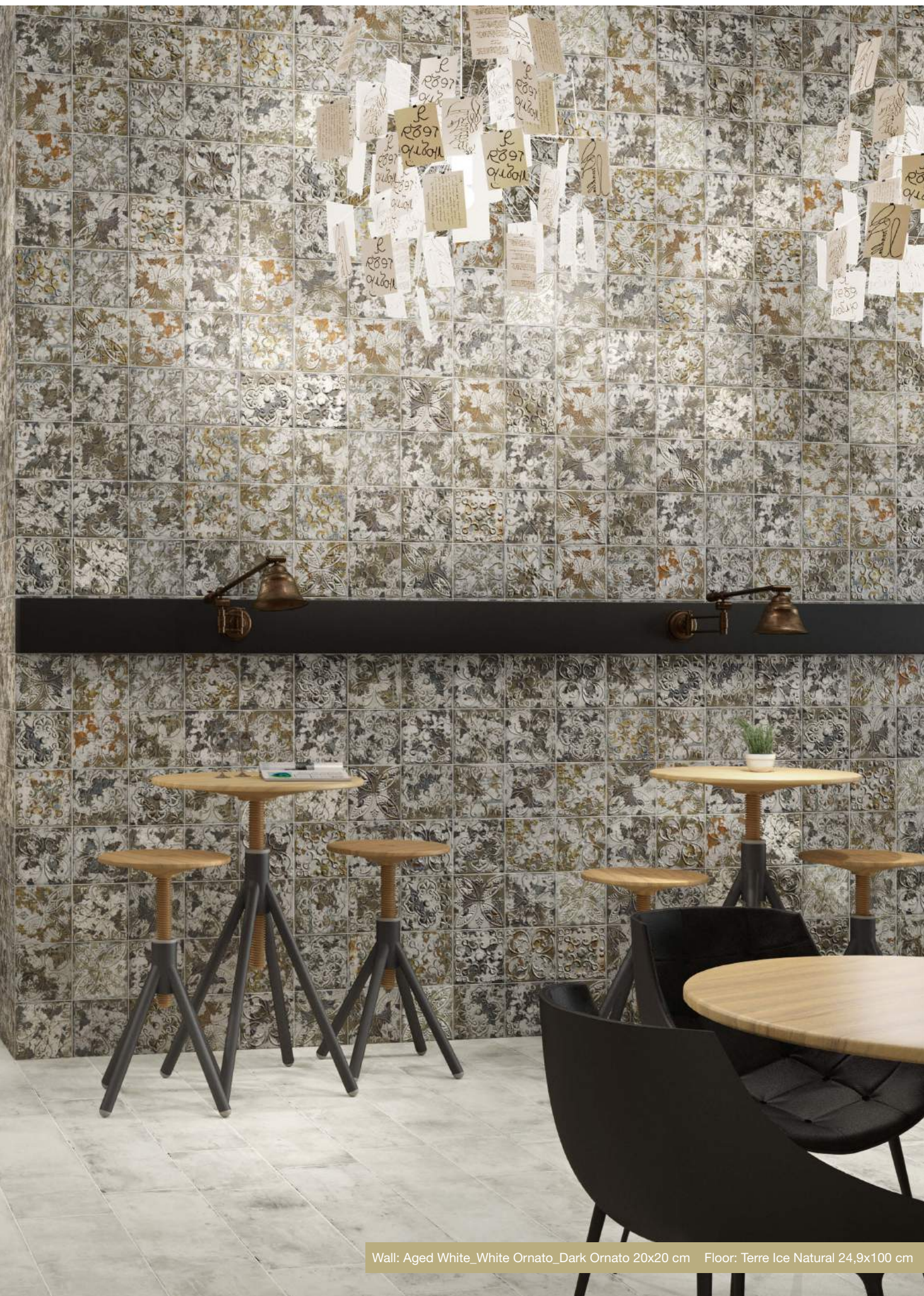
Wall: Aged White_White Ornato_Dark Ornato 20x20 cm Floor: Terre Ice Natural 24,9x100 cm