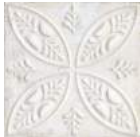
Aged White Ornato * 20x20 cm C-430