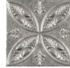
Aged Silver Ornato * 20x20 cm C-320