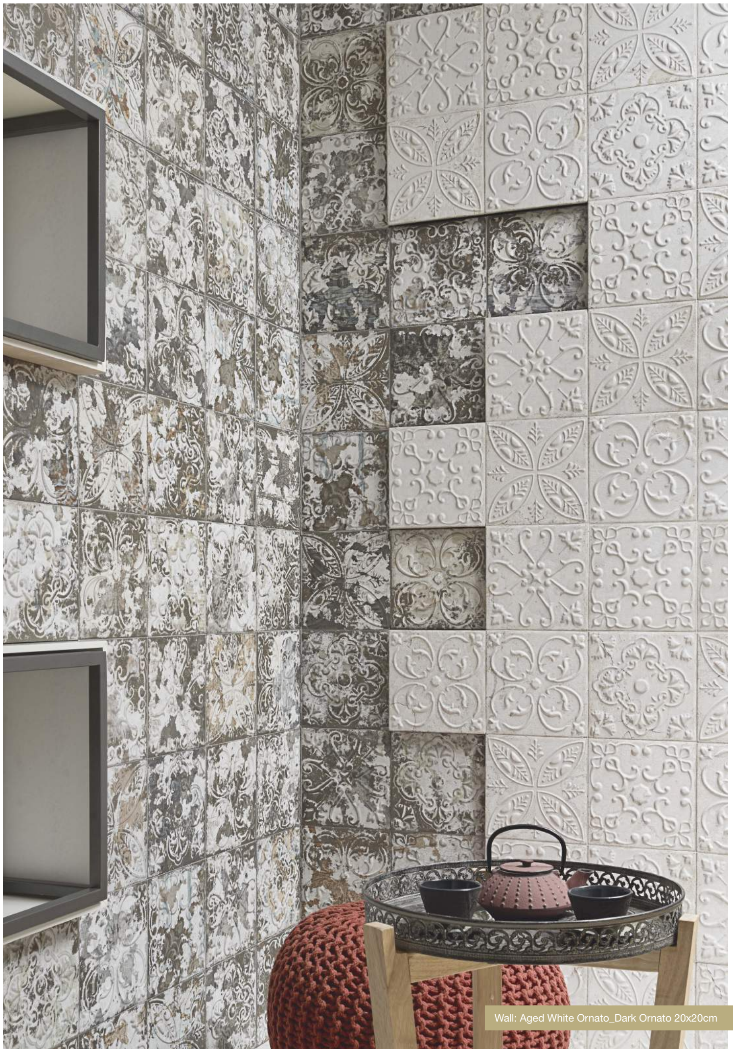
Wall: Aged White Ornato_Dark Ornato 20x20cm