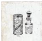
Aged Bath Decor *** 20x20 cm C-80